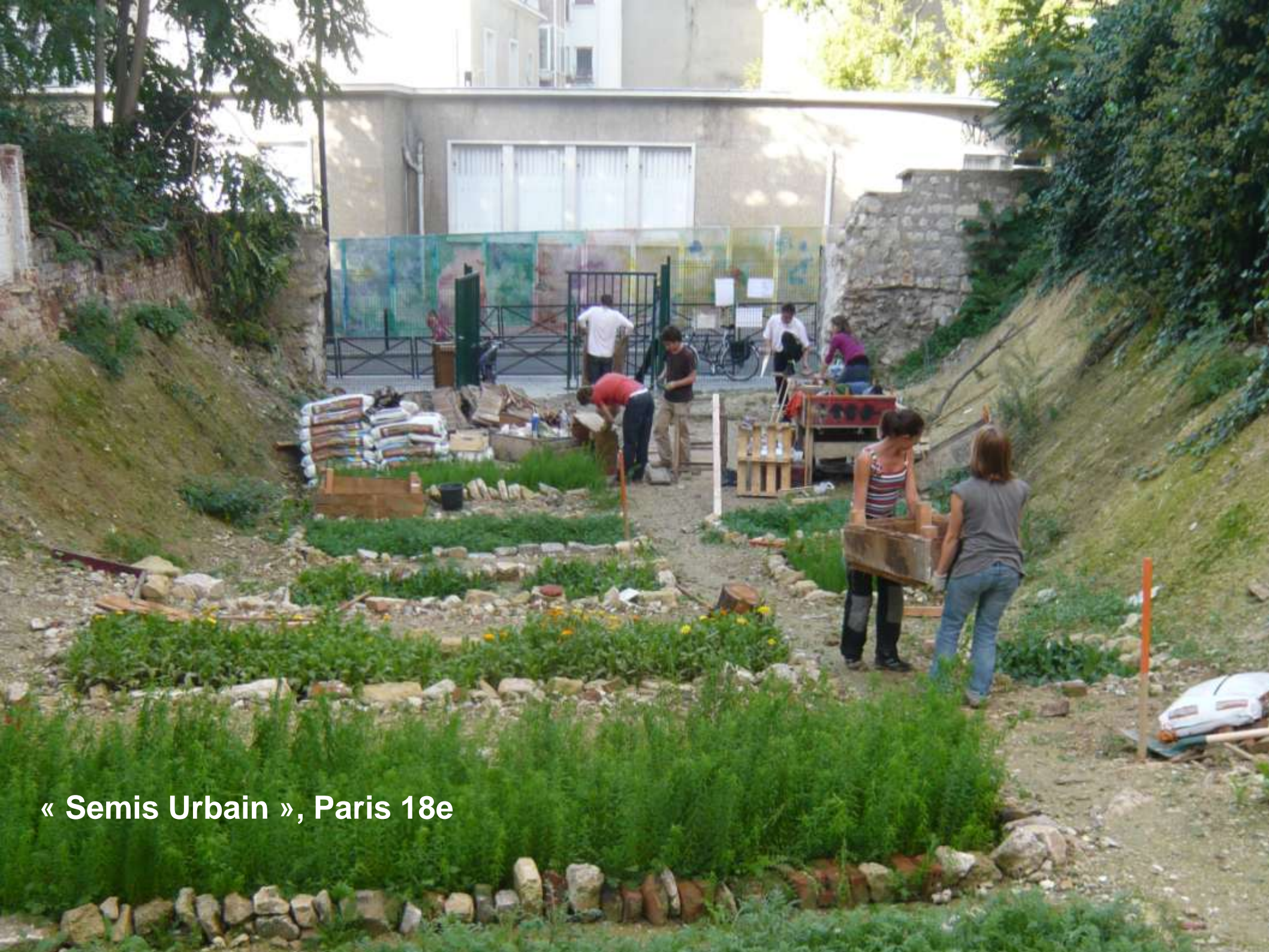
« Semis Urbain », Paris 18e