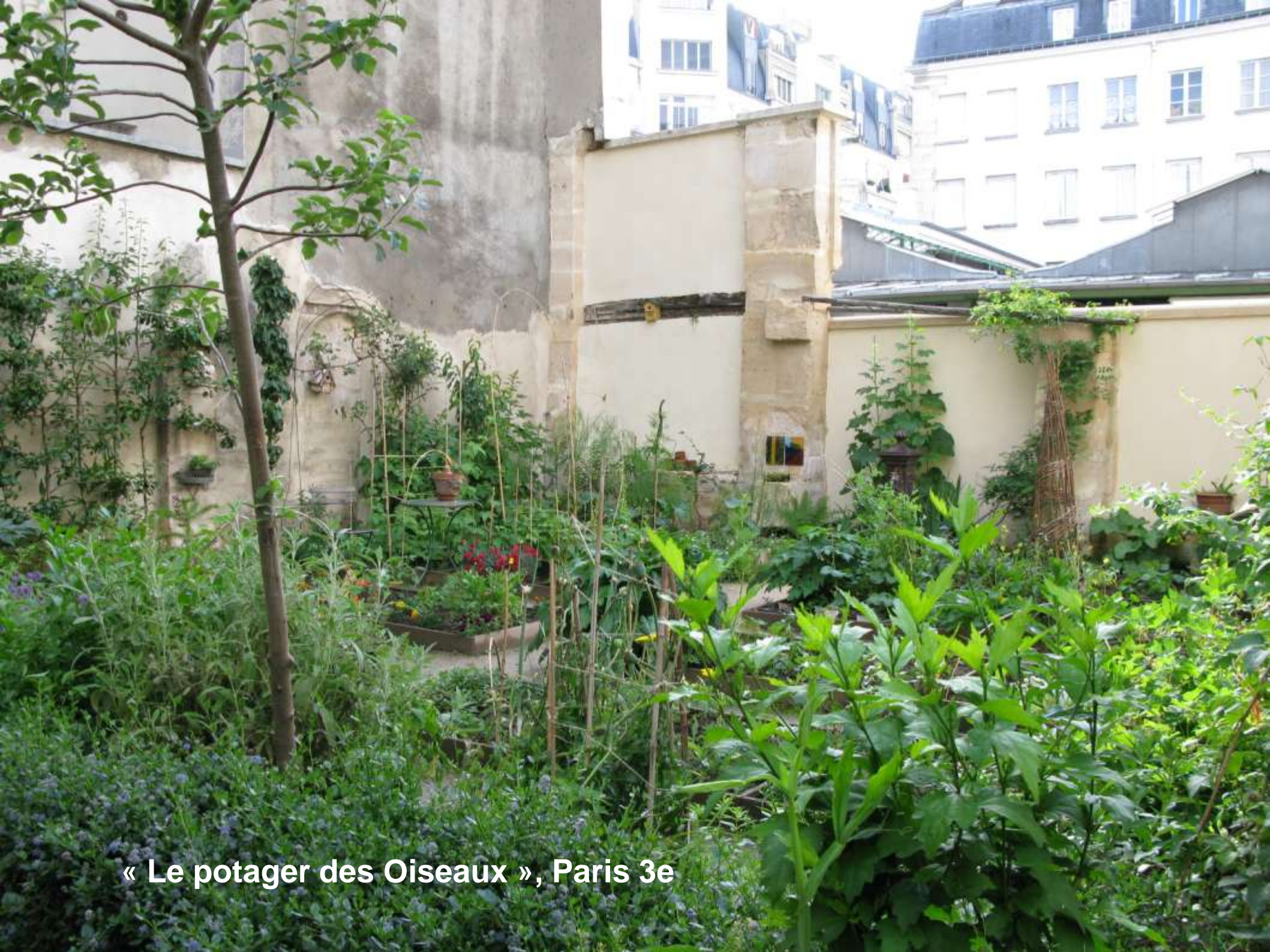
« Le potager des Oiseaux », Paris 3e