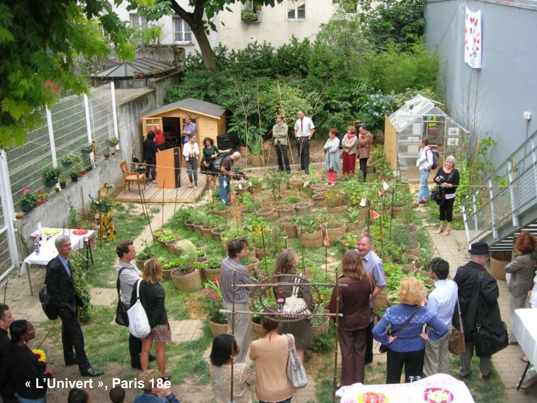
« L'Univert », Paris 18e