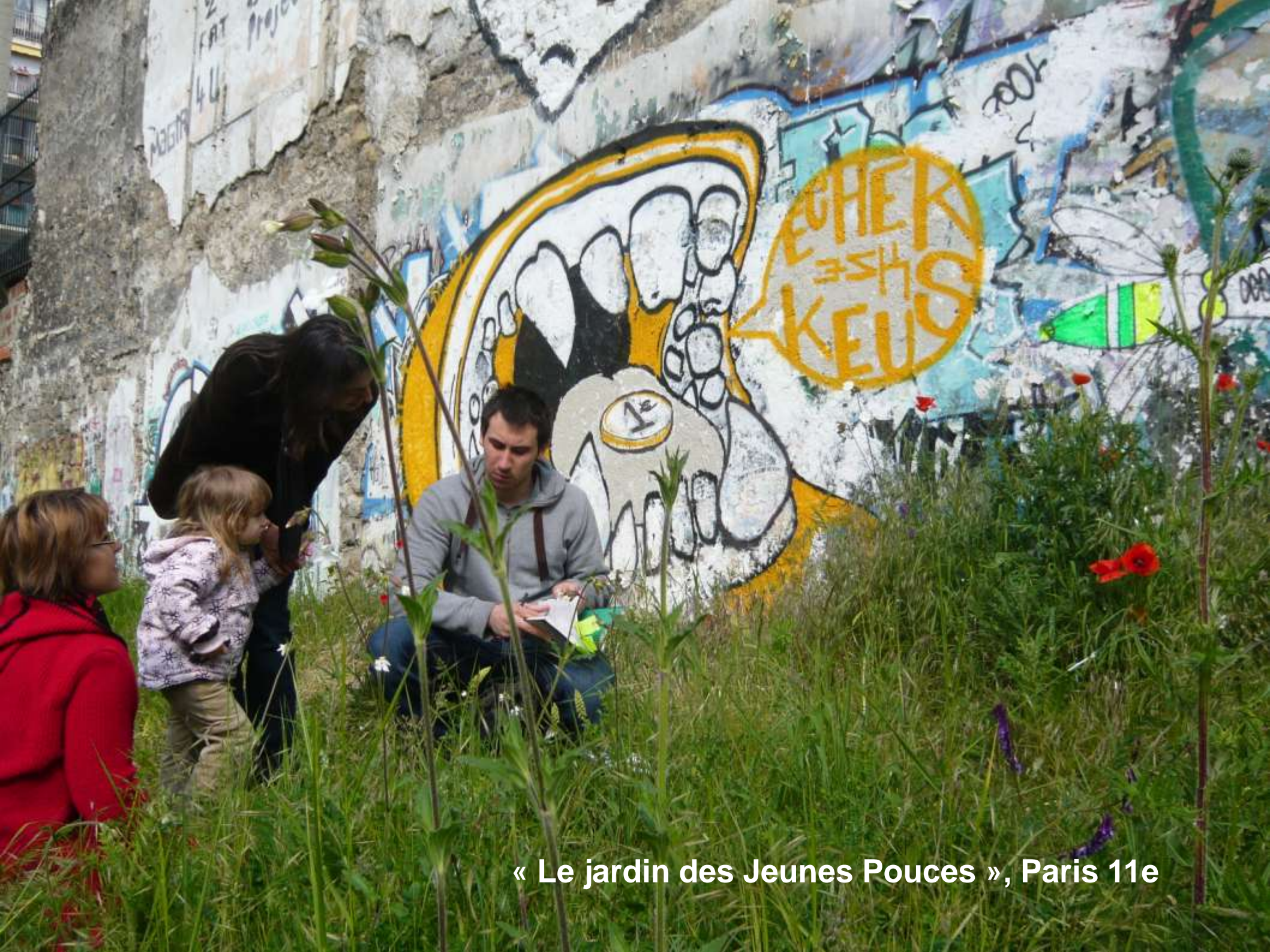
« Le jardin des Jeunes Pouces », Paris 11e