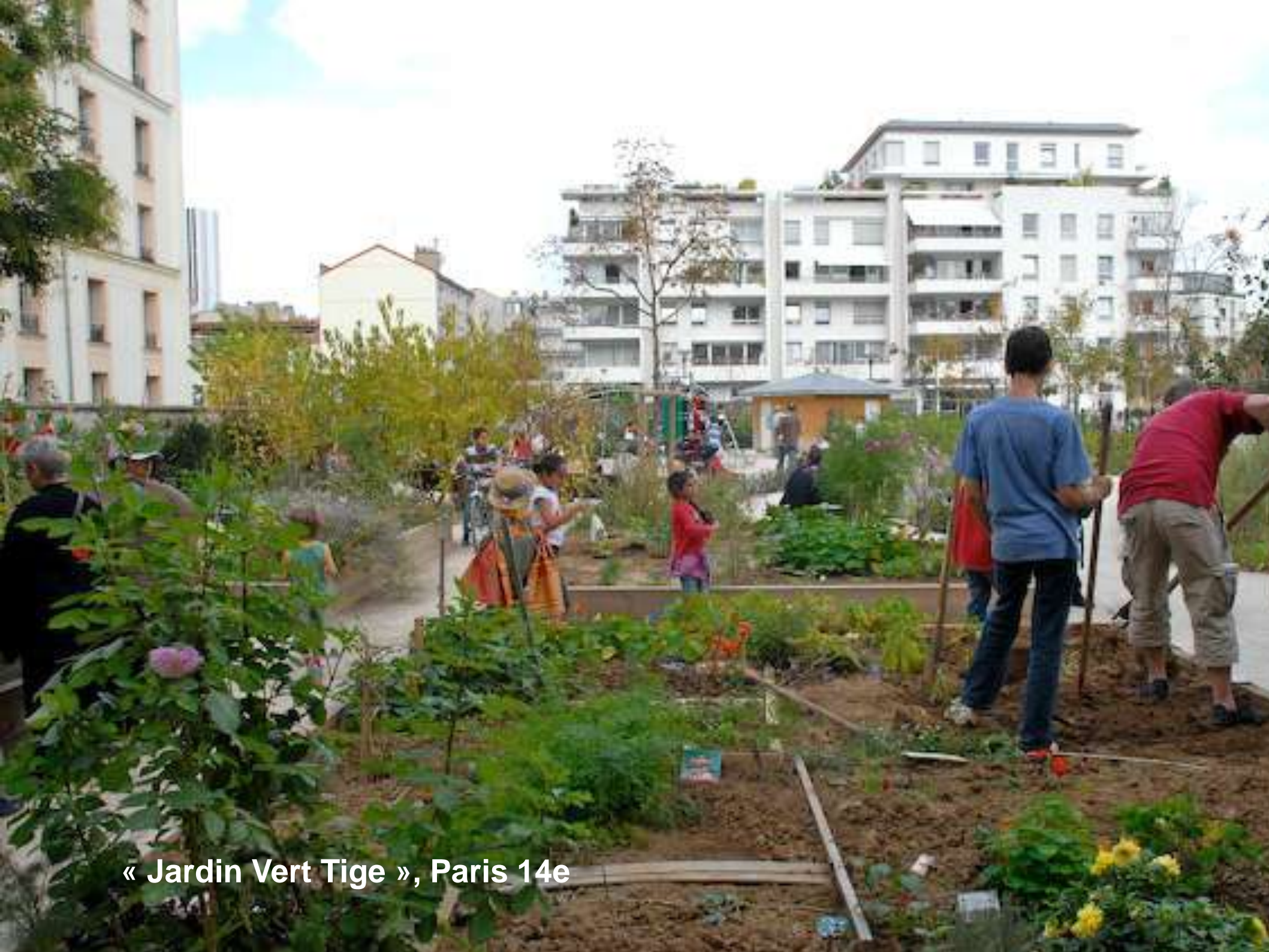
« Jardin Vert Tige », Paris 14e