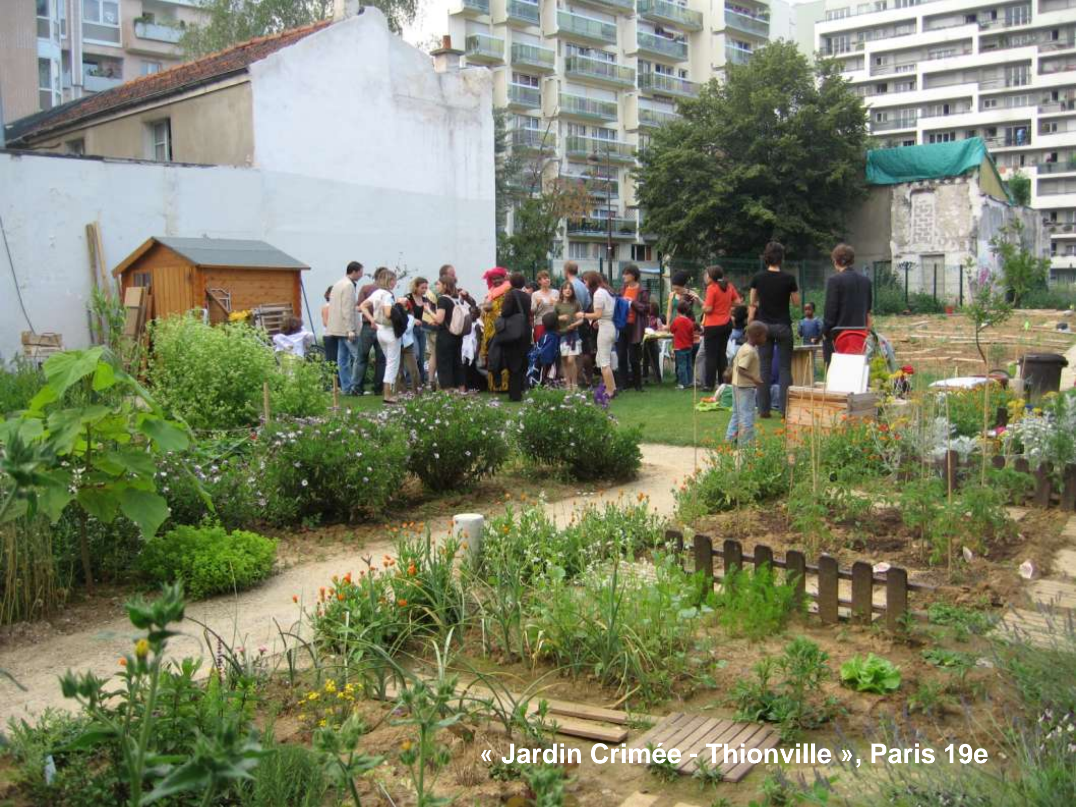
« Jardin Crimée - Thionville », Paris 19e