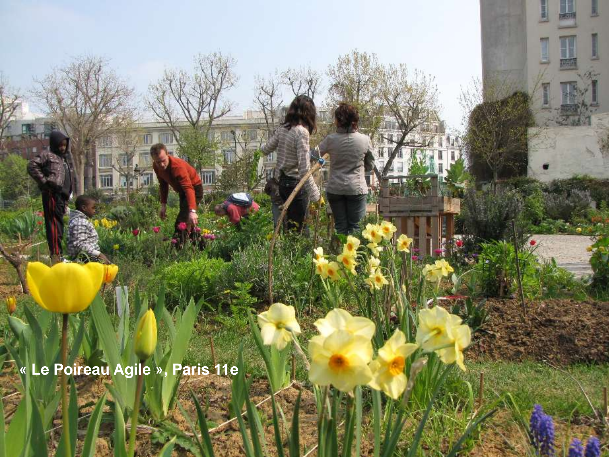
« Le Poireau Agile », Paris 11e