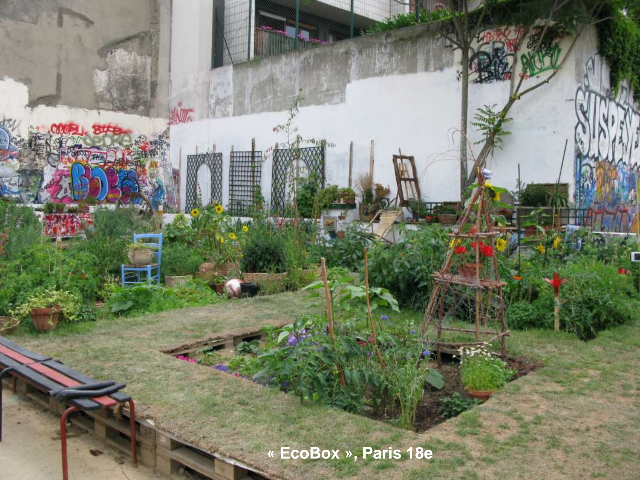
« EcoBox », Paris 18e