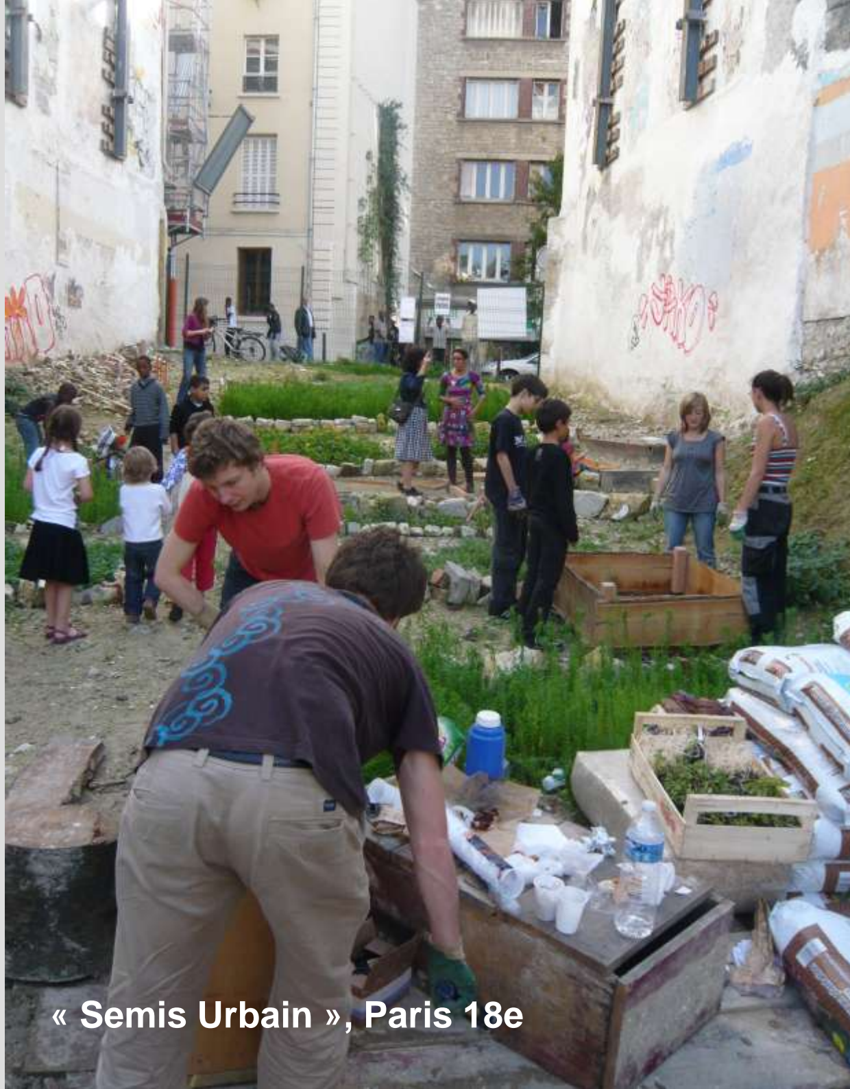
« Semis Urbain », Paris 18e