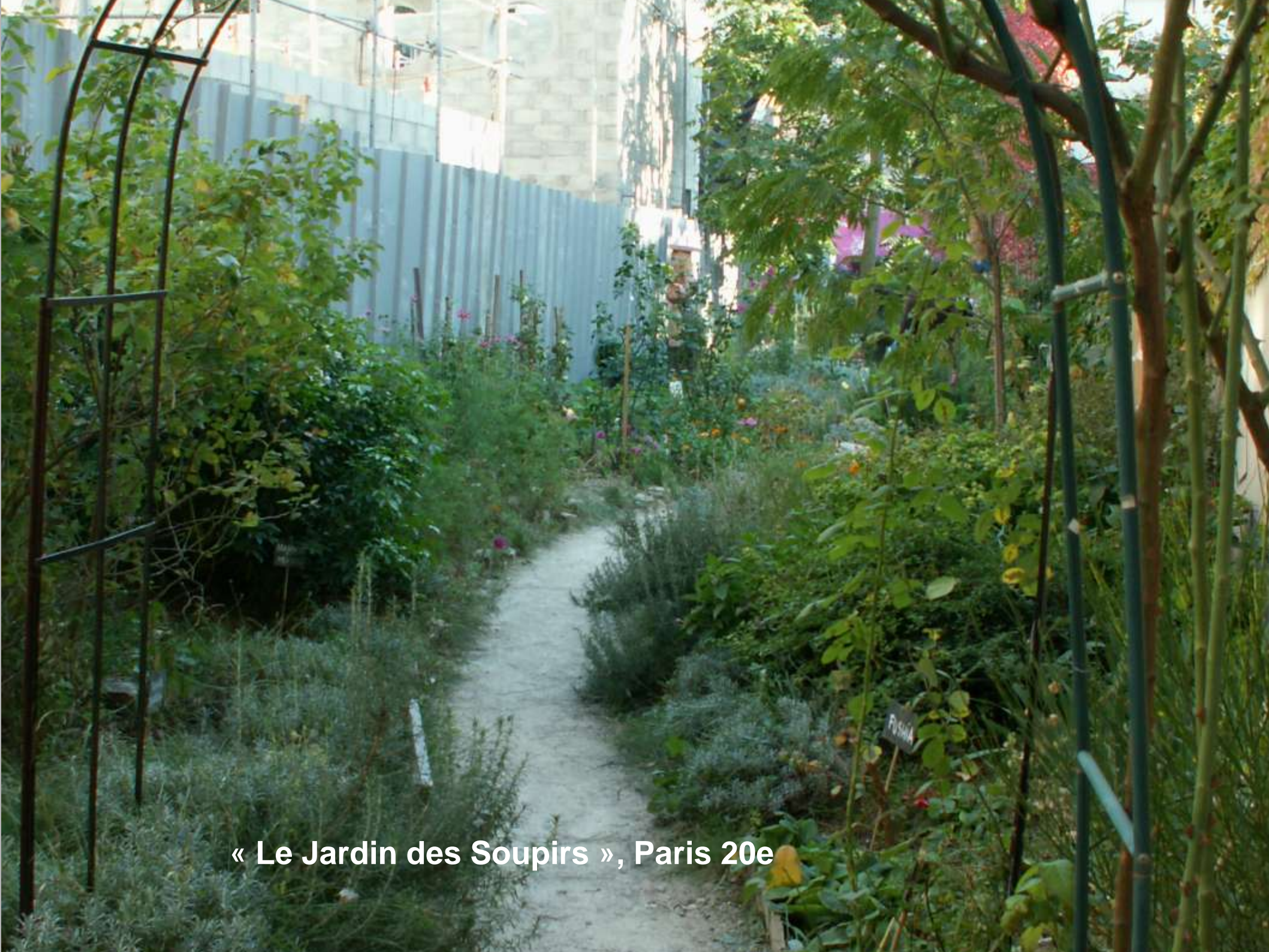
« Le Jardin des Soupirs », Paris 20e