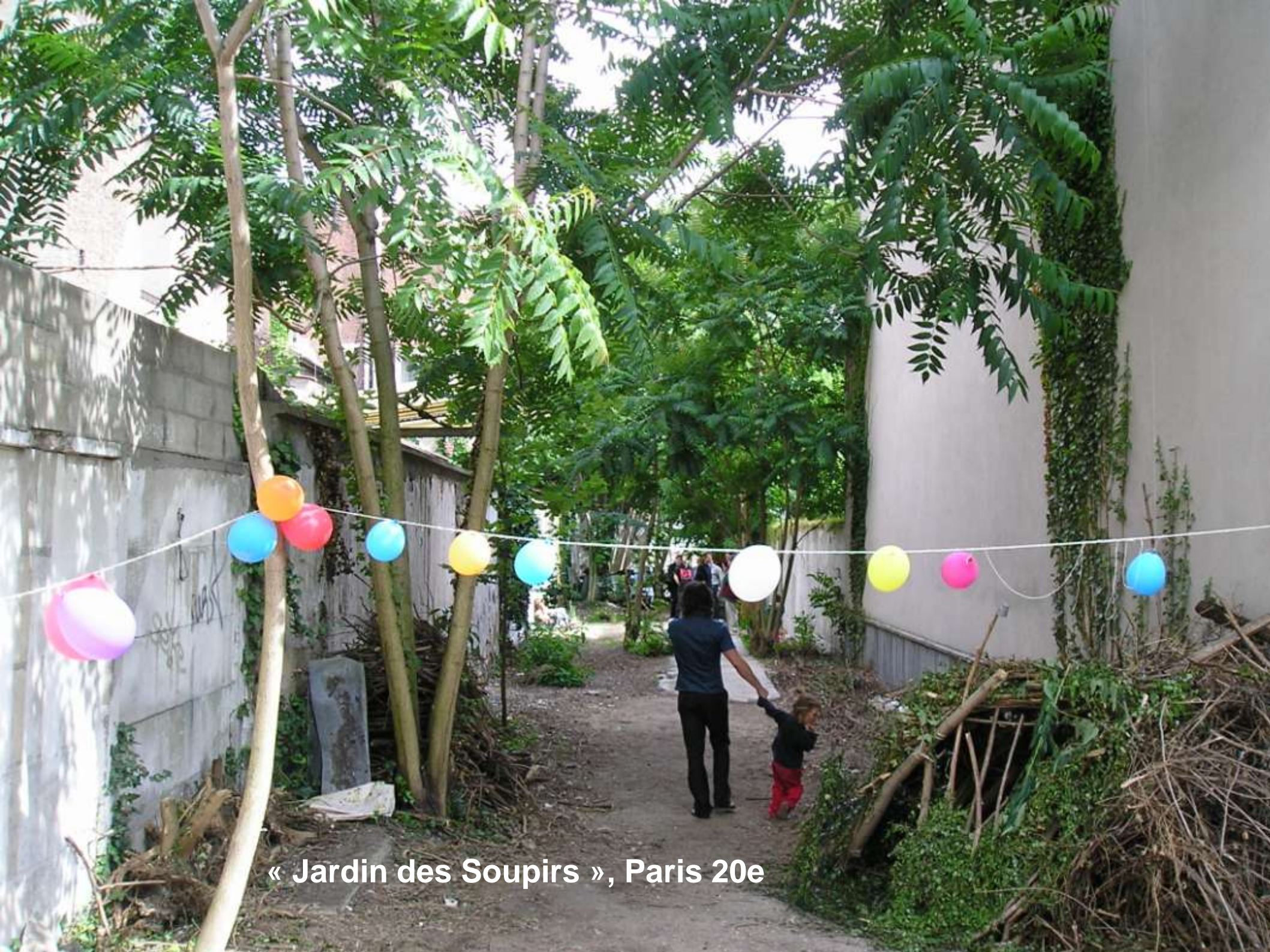
« Jardin des Soupirs », Paris 20e