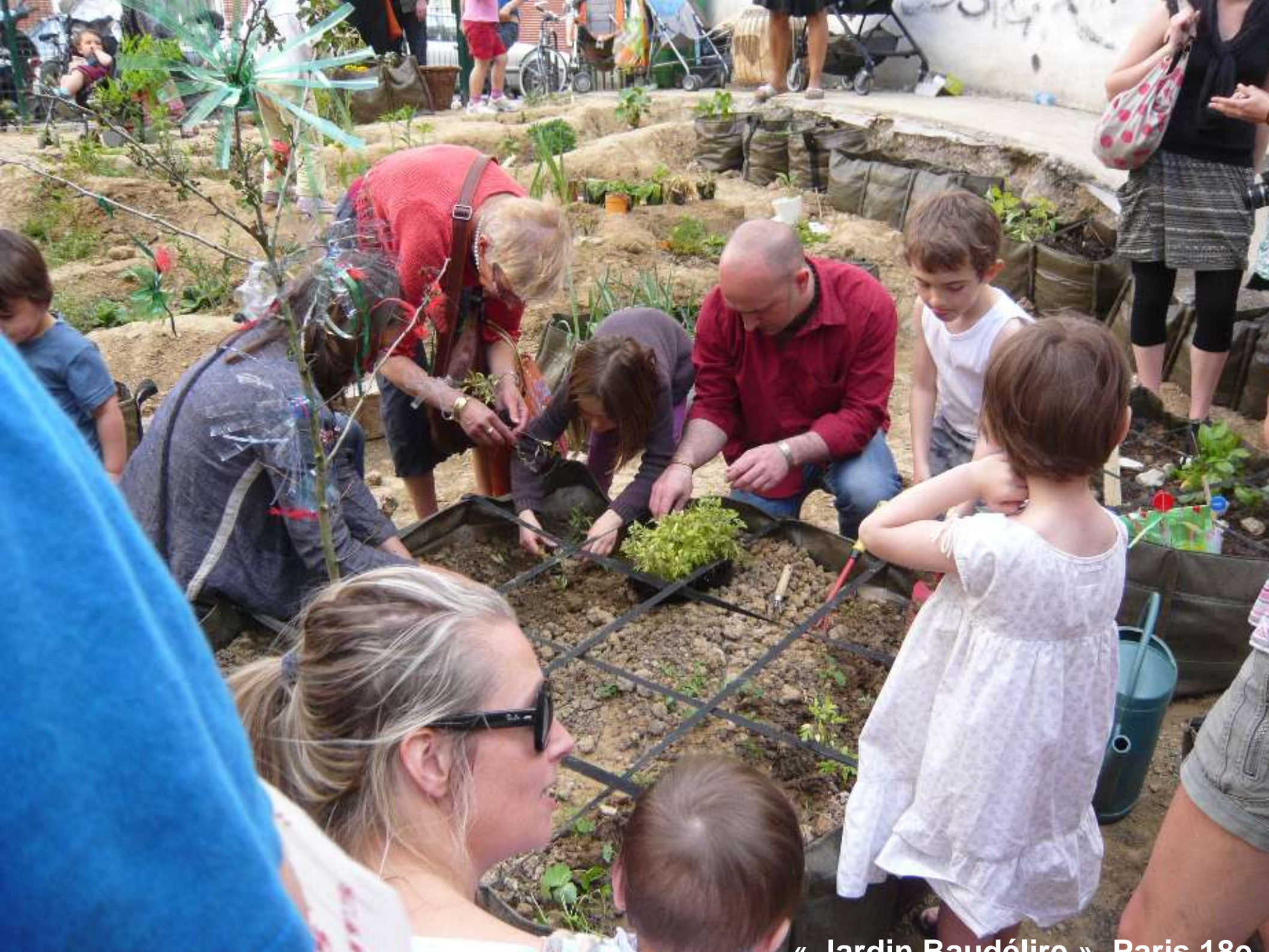
« Jardin Baudélique » Paris 18e