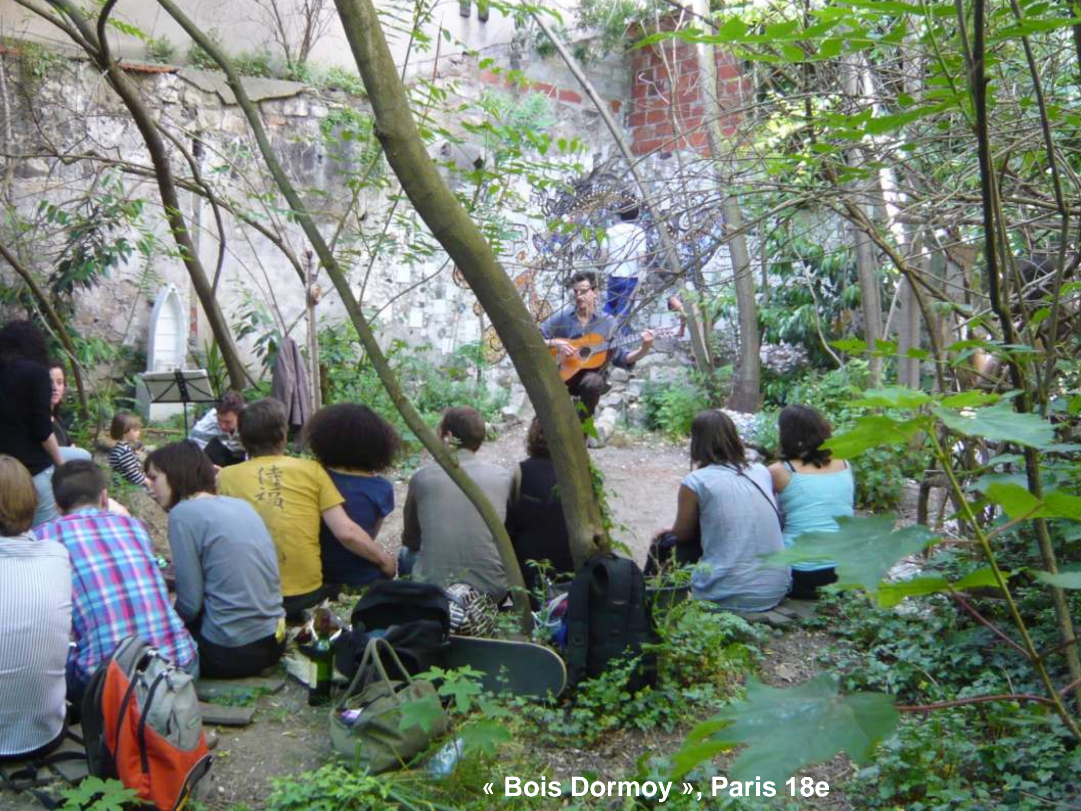
« Bois Dormoy », Paris 18e