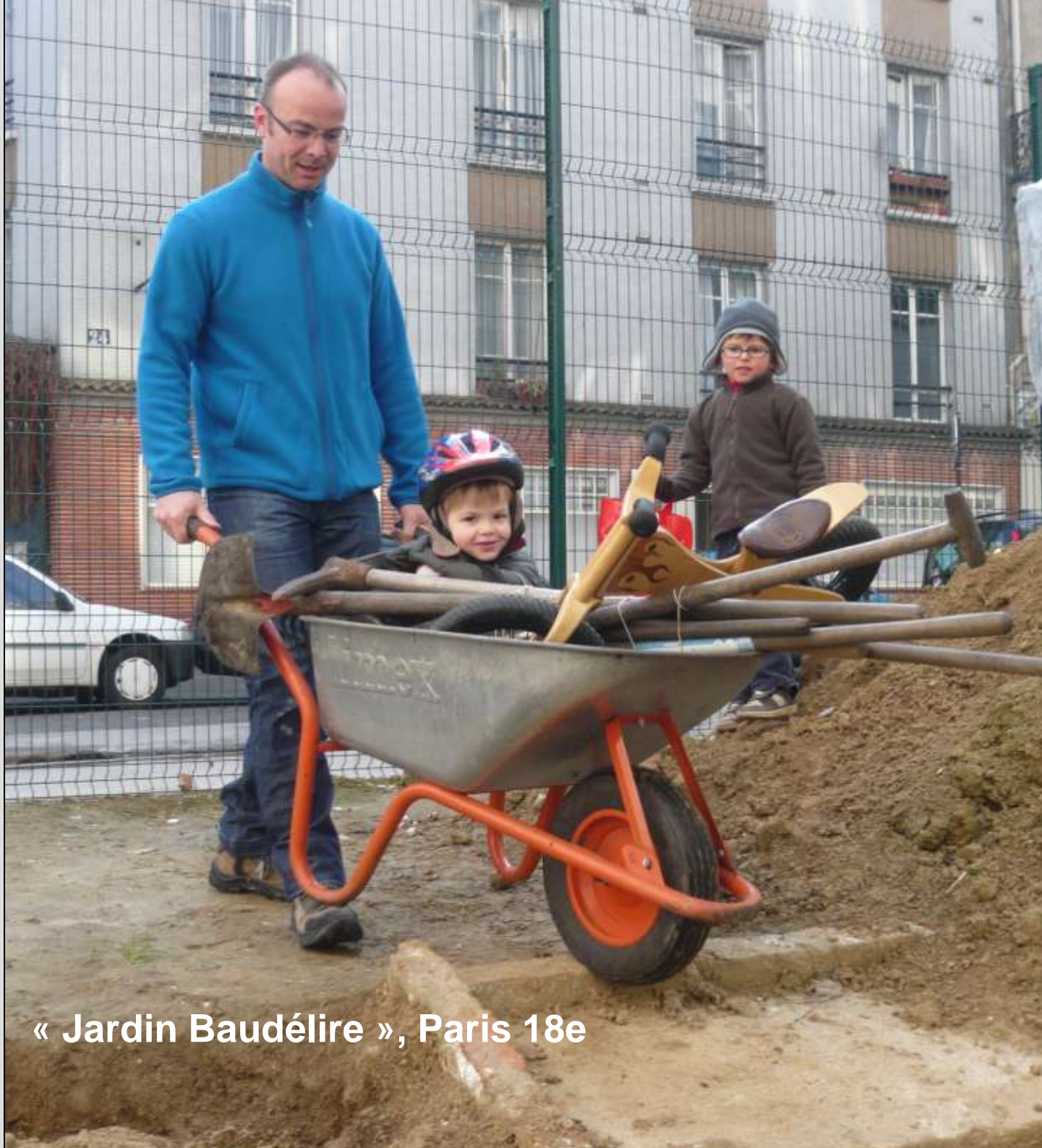
« Jardin Baudéline », Paris 18e