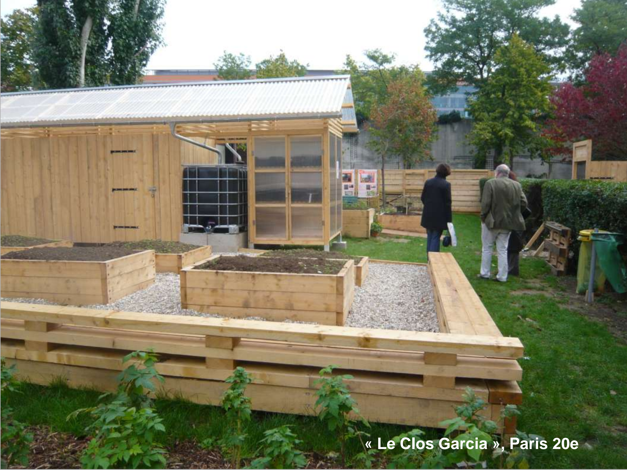
« Le Clos Garcia », Paris 20e