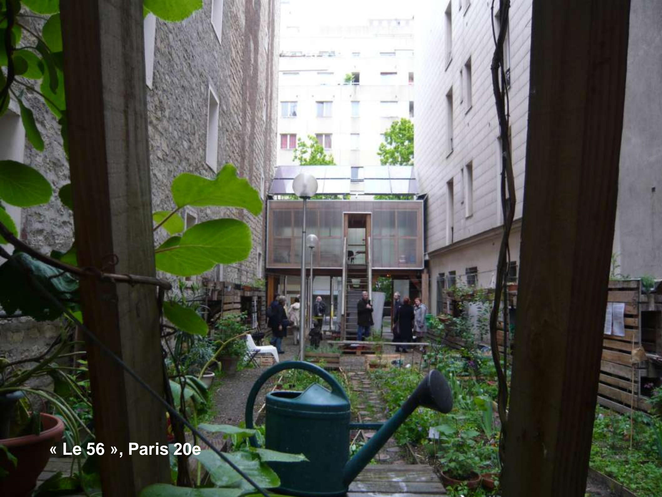
« Le 56 », Paris 20e